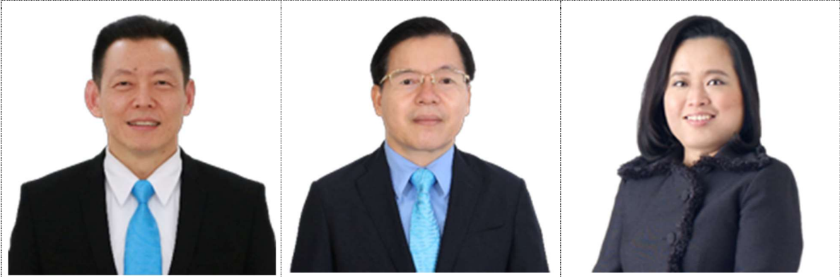
លោក Sudargo Harsono ប្រធានក្រុមប្រឹក្សាភិបាល លោក ហួត អៀងតុង អភិបាល កញ្ញា Duangdao Wongpanitkrit អភិបាល